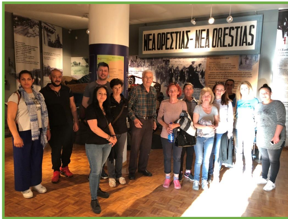
Στο Ιστορικό και Λαογραφικό Μουσείο Ορεστιάδας