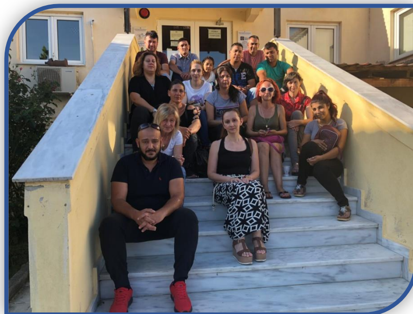
Η ομάδα μας