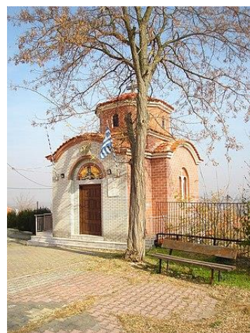
Εικόνα: Ο μικρός ναός του Αγίου Κυρίλλου ΣΤ' στο χωριό Πύθιο.