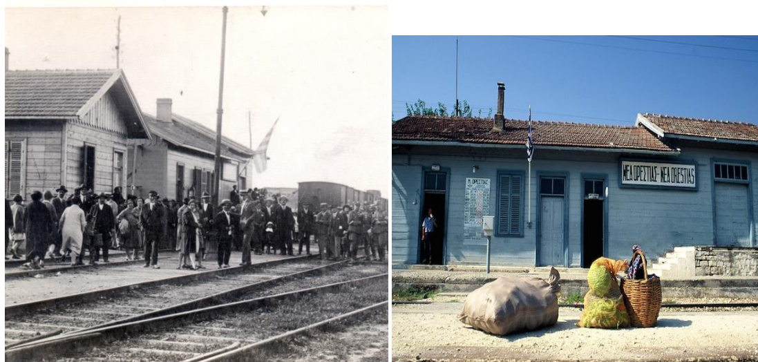
Εικόνα: Ο πρώτος σταθμός στην Ορεστιάδα το 1923 (Αριστερά) και ο σταθμός σήμερα (Δεξιά).