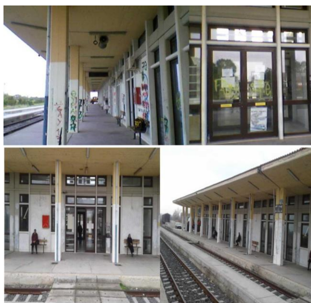
Εικόνα: Ο νέος σιδηροδρομικός σταθμός Ορεστιάδας το 2014 (πάνω) και η σημερινή του άποψη.

Στο Βόρειο Έβρο είχε την έδρα του το 16ο Διαμέρισμα των εργατών της γραμμής στο Διδυμότειχο και ομάδες γραμμής υπήρχαν στη Νέα Ορεστιάδα, τη Νέα Βύσσα, τα Δίκαια, το Πύθιο και τα Μαράσια. Η αυξημένη ζήτηση άλλωστε στο νομό ήταν γεγονός και για το λόγο αυτό κρίθηκε απαραίτητη η κατασκευή νέων μεγάλων επιβατικών σταθμών για να ικανοποιήσουν τις ανάγκες του επιβατικού κοινού. Αρχικά το 1986 εγκαινιάστηκε ο νέος σταθμός του Διδυμοτείχου και 10 χρόνια αργότερα δόθηκε σε λειτουργία ο μεγαλοπρεπής νέος σιδηροδρομικός σταθμός της Νέας Ορεστιάδας. Ο νέος σταθμός της πόλης εγκαινιάστηκε επίσημα στις 16-9-1996. Την περίοδο εκείνη ο σταθμός είχε τεράστια εμπορική και επιβατική κίνηση. Σύμφωνα με το Σύλλογο Φίλων του Σιδηροδρόμου (1996) είχε την τρίτη μεγαλύτερη επιβατική κίνηση στην Βόρεια Ελλάδα.